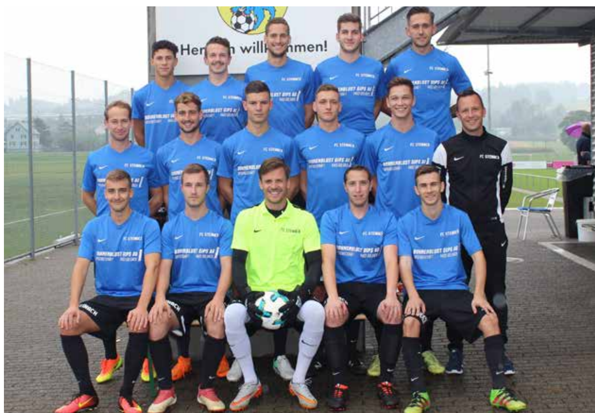
Tenü-Sponsoren: Bohnenblust Gips AG, Goldach und Bienz Optik AG, St. Gallen