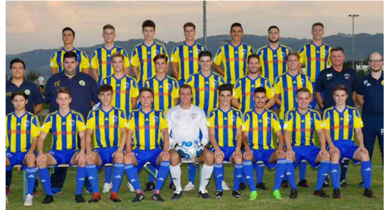
Tenü-Sponsoren: TE Connectivity Solutions GmbH Steinach, Raiffeisenbank Regio Arbon, Steinach, Artis Treuhand GmbH, Arbon, Berit Paracelsus-Klinik AG, Speicher

Auf den FC Steinach wartet eine sehr spannende Saison in dieser Liga, aber darauf freut sich das gesamte Team.