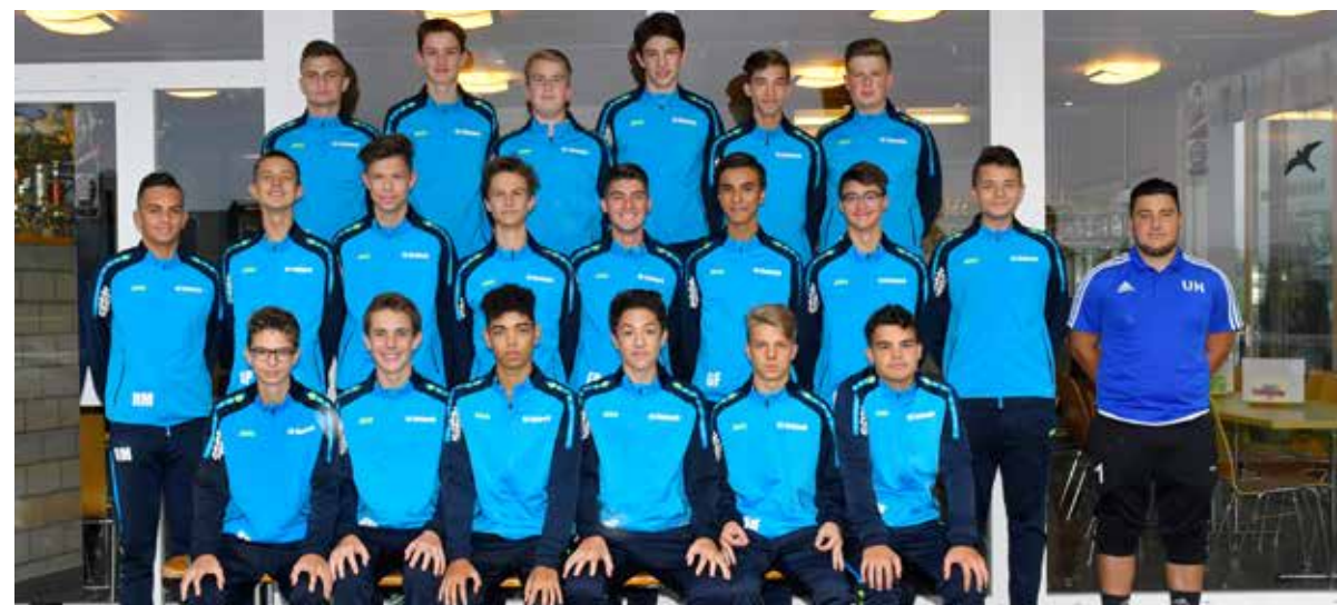
Trainer: Urs Hasler Co-Trainer: Markus Hasler (fehlt)