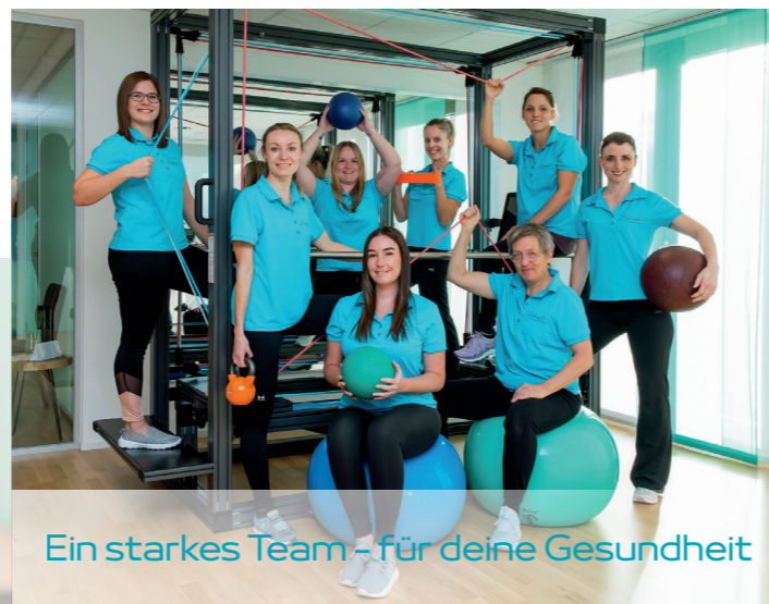
Ein starkes Team - für deine Gesundheit

Schulstrasse 2 9323 Steinach 071525 93 23 www.lakeside-physiotherapie.ch